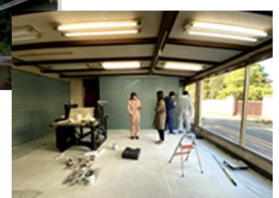
遊休施設をアート交流拠点施設に整備