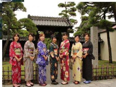
古民家を情報発信拠点施設に整備