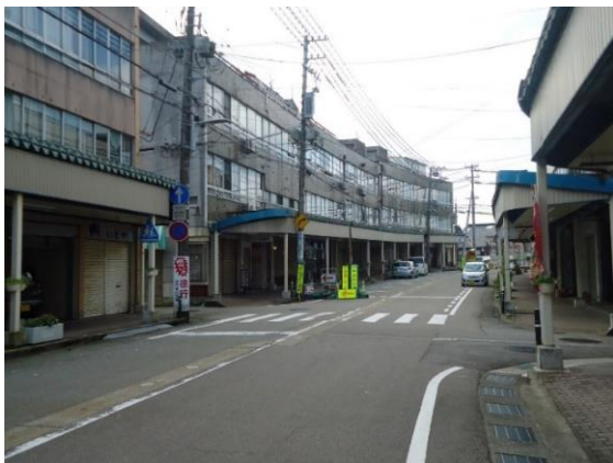
氷見市中央町商店街の様子