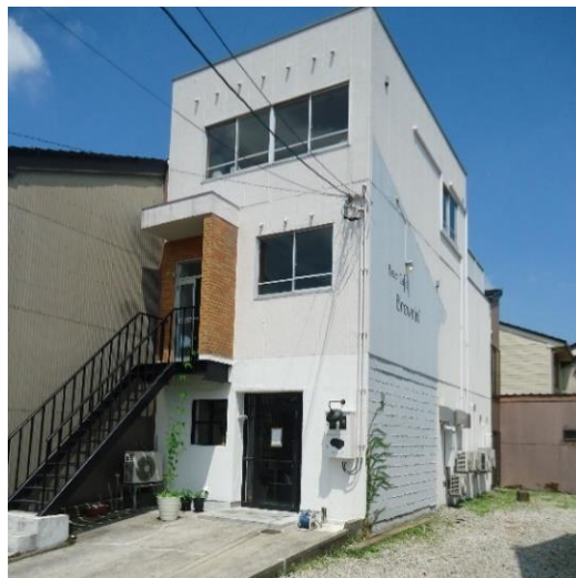
3階建てのビルを、クラフト ビールカフェにリノベーション